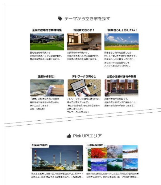
▲「アットホーム 空き家バンク」物件特集