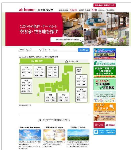
▲「アットホーム 空き家バンク」トップページ