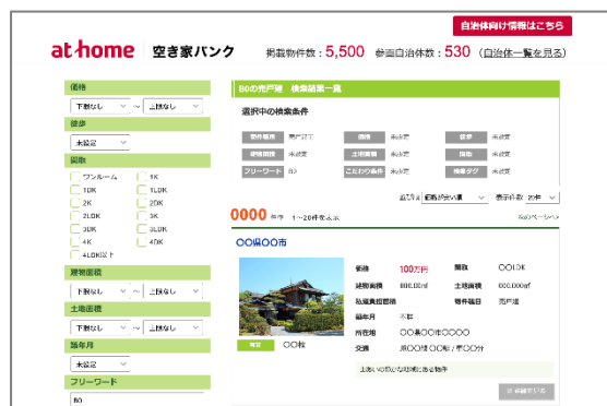
▲検索結果一覧ページ