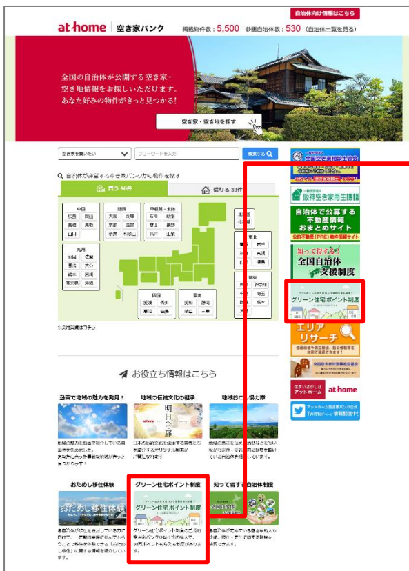
▲「アットホーム 空き家バンク」トップページ