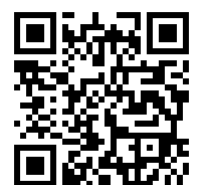
▲アプリの詳細・無料ダウンロードはこちらから