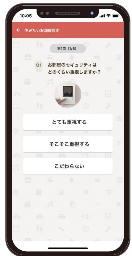
▲一人暮らしの学生向け「住みたいお部屋診断」画面イメージ

オンラインによる住まい探し需要は年々増えており、そのニーズも日々目まぐるしい勢いで変化しています。私たちのミッションは、消費者ニーズをいち早くキャッチし、それを次なるサービスにつなげていくことだと感じています。今後は、お部屋探しから引越しまでの消費者行動をより広範囲でオンライン化することに注力し、消費者のお部屋探しをより快適にできるようサービスの改善・拡充に取り組んでまいります。