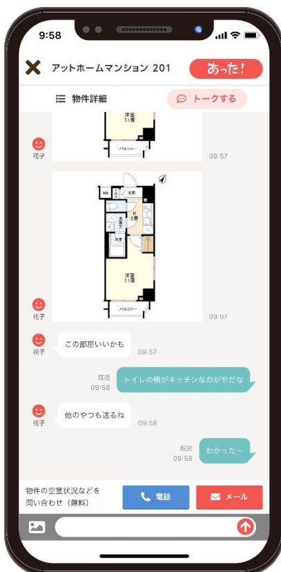
▲「トーク」機能画面イメージ