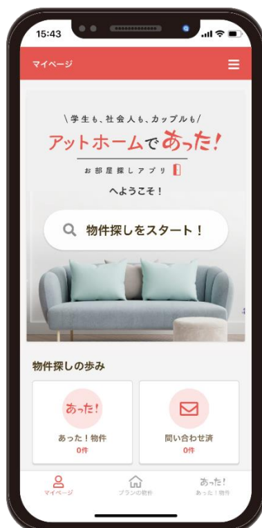
▲「アットホームであった！」トップ画面イメージ

近年オンラインでの住まい探し需要が高まる中、アットホームはそれぞれのライフスタイルやこだわりに寄り添った快適な住まい探しの環境を提供してまいります。