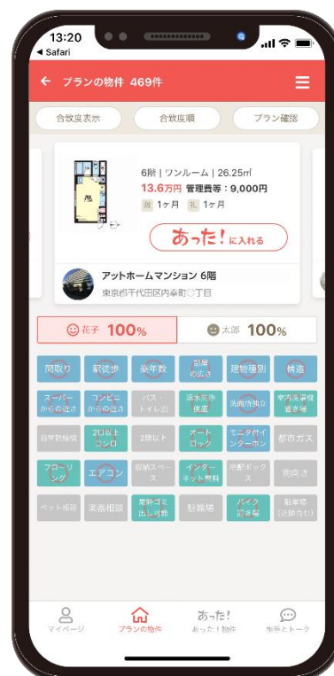
▲物件検索結果一覧画面イメージ。希望条件との合致度が一目で分かる