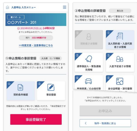
▲「スマート申込」入居申込入力メニュー画面イメージ