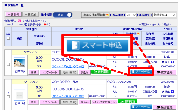
▲「ATBB」検索結果一覧画面イメージ。「スマート申込」というボタンから入居申込手続きが可能

2019年8月よりアットホームが提供している、パソコンやスマートフォン、タブレット端末などのデバイスを用いて専用フォームに必要な情報を入力するだけで入居申込をオンラインで行えるサービスで、家賃債務保証会社との取次連携も可能です。不動産仲介会社は無料で利用可能で、さらに不動産管理会社に対しては2021年5月末まで初期費用・利用料が無料となるキャンペーンを実施しています。