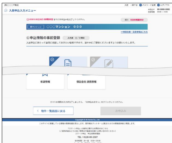
▲「スマート申込」入居申込入力メニュー画面イメージ