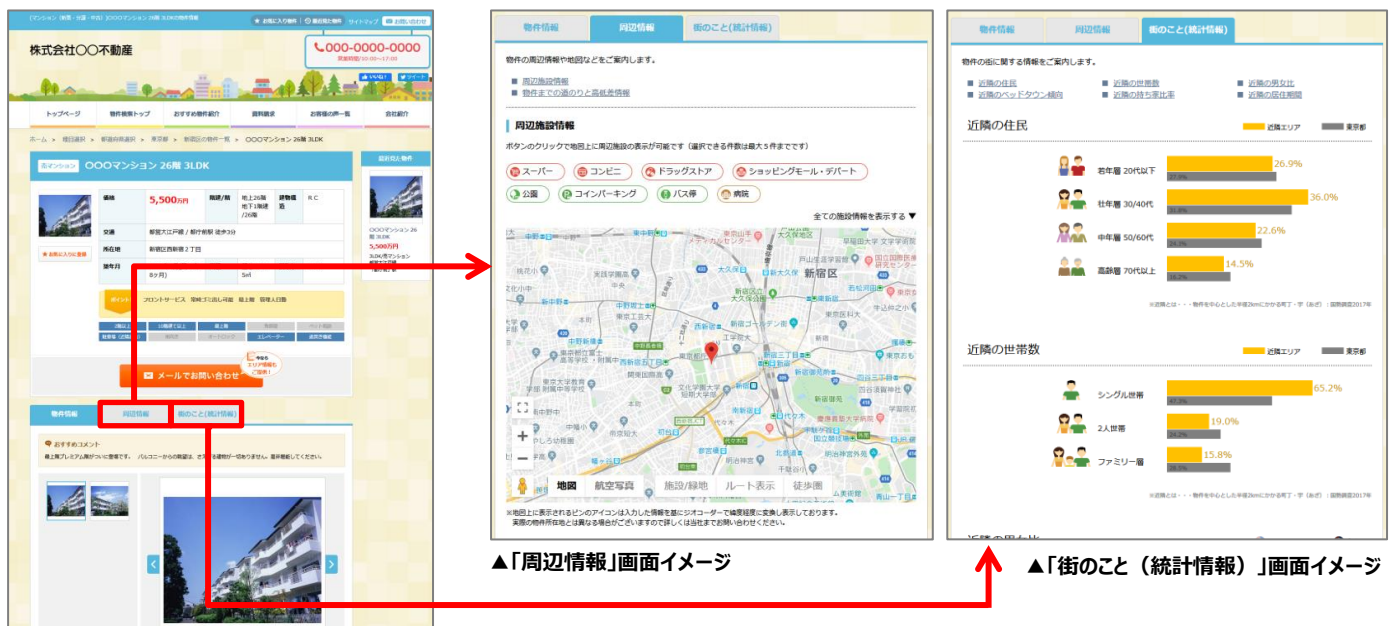
▲「周辺情報」画面イメージ